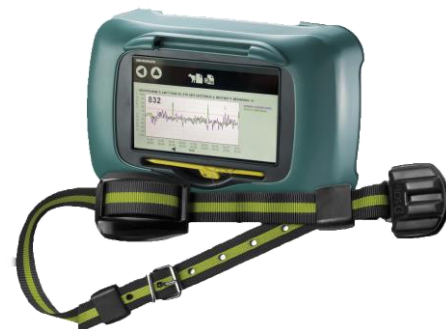
RuminAct® LD system. Kommunikation med transponder over store områder.