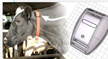
Kombineret drøvtygnings- og aktivitetsmåling