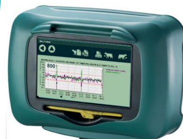
Ko i normal cyklus